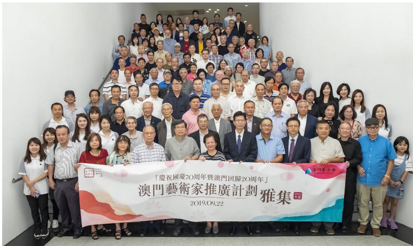
2019 澳門藝術家推廣計劃雅集交流活動,現場展示 85 位參與“澳門藝術家推廣計劃”藝術家的個人畫集。